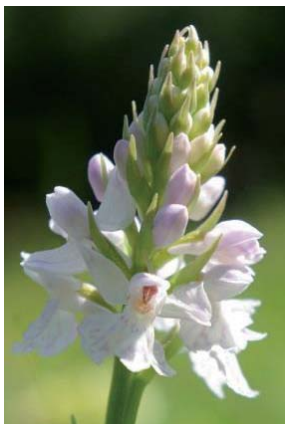
Orchis des bruyères

Damien vous propose de venir l'aider à préserver notre patrimoine naturel lors des chantiers d'automne et à découvrir ces espèces.