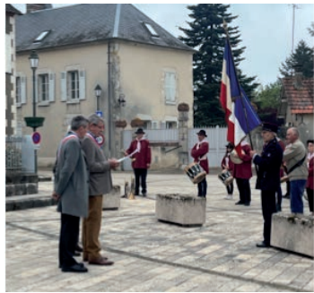
CÉRÉMONIE du 8 Mai 2023