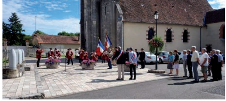
CÉRÉMONIE du 14 Juillet 2023