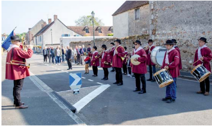
Merci à la Fanfare de L'Ocre toujours présente à nos cérémonies.